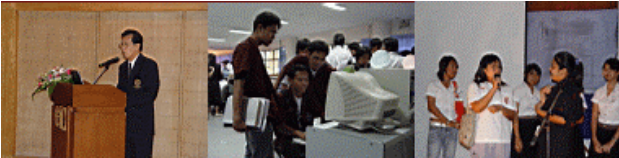
ภาพบรรยากาศงานเปิดตัวระบบสารสนเทศมหาวิทยาลัย (SUPREME2004)

สำนักคอมพิวเตอร์ บัณฑิตวิทยาลัย กองบริการการศึกษา และกองกิจการนิสิต ได้ร่วมกันจัดงานเปิดตัวระบบสารสนเทศ มหาวิทยาลัย (SUPREME2004) เพื่อเป็นการนำเสนอและประชาสัมพันธ์ระบบงาน โดยเฉพาะระบบลงทะเบียนนิสิตแก่นิสิต อาจารย์ผู้สอน อาจารย์ที่ปรึกษา เพื่อให้รับทราบระบบงานและประโยชน์จากระบบงานดังกล่าว ในวันที่ 15 กันยายน 2547 โดยท่านอธิการบดีให้เกียรติเป็นประธานเปิดงานระบบสารสนเทศมหาวิทยาลัย (SUPREME2004) อย่างเป็นทางการ ณ มศว ประสานมิตร และวันอังคารที่ 21 กันยายน 2547 ได้จัดกิจกรรมต่อเนื่อง ณ มศว องครักษ์ จากการจัดงานครั้งนี้ มีนิสิต คณาจารย์ และบุคลากร ให้ความสนใจเป็นอย่างมาก