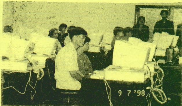
"ผู้เข้าร่วมการอบรมวิชา ไมโครซอฟท์วิที"

‘ติดตามอ่าน จดหมายข่าวสำนักคอมพิวเตอร์ บน WWW ได้ที่’