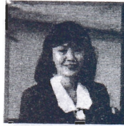
ผู้อำนวยการสำนักคอมพิวเตอร์ มศว

ผู้ช่วยศาสตราจารย์ศิริบุษ เกียนรุ่งโรจน์