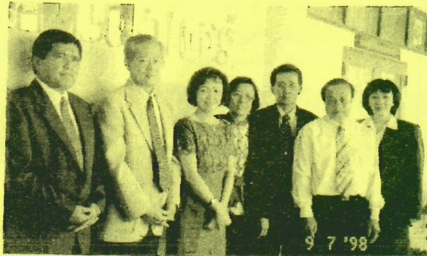
"พิธีเปิดสำนักคอมพิวเตอร์ สำนักงาน องค์กรักษ์"