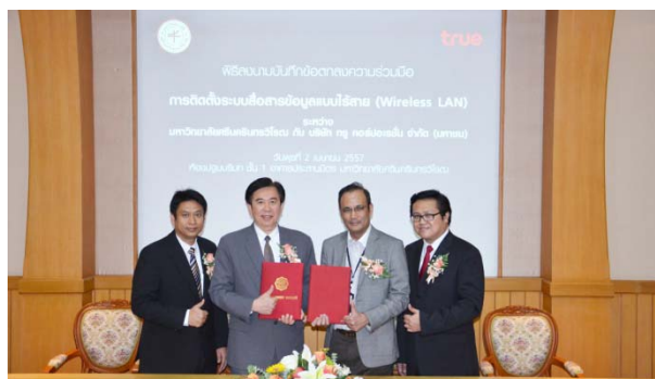
ภาพ 1 : พิธีลงนามบันทึกข้อตกลงความร่วมมือ เมื่อวันที่ 2 เมษายน 2557 ณ ห้องประชุมบริบท ชั้น 1 อาคารประสานมิตร