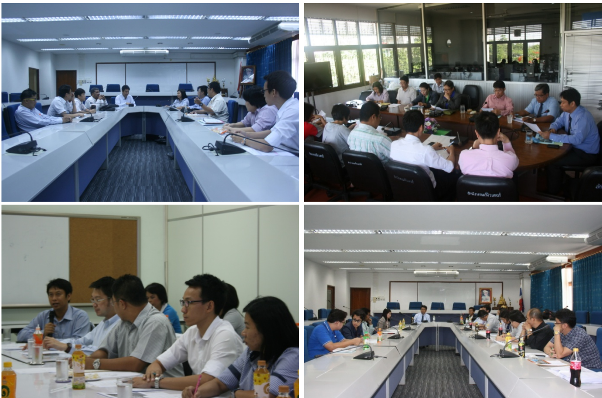
ภาพ 4 : คณะผู้บริหารและบุคลากรสำนักคอมพิวเตอร์ สัณจรหน่วยงานภายใน มศว องครักษ์

สำนักคอมพิวเตอร์มีนโยบายการบริหารงานและการให้บริการในเชิงรุก โดยคณะผู้บริหารและบุคลากรจัดกิจกรรม สัณจรหน่วยงานต่างๆ เพื่อแนะนำบริการสำนักคอมพิวเตอร์ เผยแพร่องค์ความรู้ แนวปฏิบัติที่ดี รับฟังความเห็นและแก้ไข ปัญหาระบบไอซีที (ICT) ของมหาวิทยาลัย ซึ่งเป็นเวทีกลางให้ประชาคม มศว ได้แลกเปลี่ยนเรียนรู้ จนเกิดเป็นองค์ความรู้ ที่สามารถนำไปใช้งานได้จริง และเป็นแนวปฏิบัติที่ดี เพื่อนำมาพัฒนางานให้บริการสำนักคอมพิวเตอร์มีประสิทธิภาพ ยิ่งขึ้น สำหรับในปีงบประมาณ พ.ศ. 2557 สำนักคอมพิวเตอร์เริ่มจัดกิจกรรมสัณจรหน่วยงาน ณ หน่วยงานภายใน มศว องครักษ์ ระหว่างเดือนพฤษภาคม ถึงเดือนมิถุนายน 2557 ซึ่งผู้บริหารระดับสูงได้ลงมาปฏิบัติงานร่วมกับบุคลากรสำนัก คอมพิวเตอร์ เพื่อมุ่งการทำงานเป็นทีม (Teamwork) และสร้างสรรค์บริการที่ดีให้แก่ผู้ใช้งาน