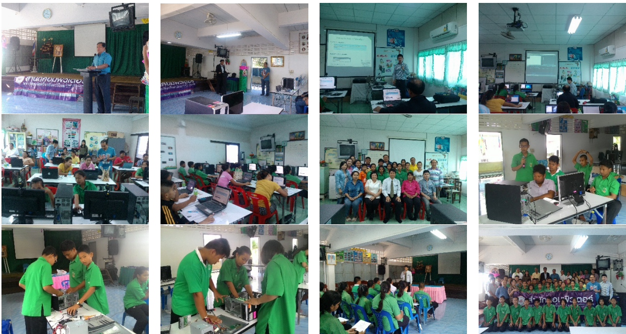
ภาพ 5 : ประมวลภาพการจัดอบรมในโครงการเตรียมความพร้อมบุคลากรทางการศึกษาด้วยไอซีทีสู่ประชาคมเศรษฐกิจอาเซียน ระยะ 2

โดยอบรมครั้งที่ 1 ระหว่างวันที่ 12 - 14 ธันวาคม 2557 และอบรมครั้งที่ 2 ระหว่างวันที่ 23 - 25 มกราคม 2558 ณ โรงเรียนวัดโพธิ์แทน อำเภอองครักษ์ จังหวัดนครนายก