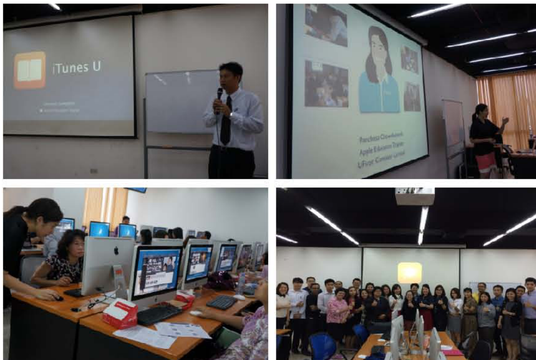
ภาพ 3 : การอบรมพัฒนาสื่อการเรียนการสอนบน iTunes U ให้แก่คณาจารย์ที่เข้าร่วมโครงการ ฯ