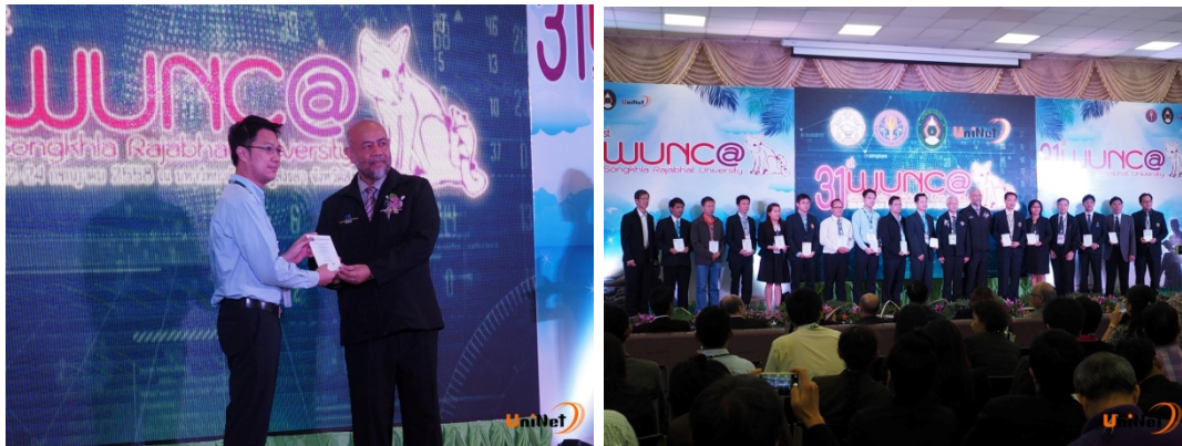
ภาพ 7 : พิธีมอบรางวัล IPv6 Ready Pioneer Award

และมหาวิทยาลัยศรีนครินทรวิโรฒได้รับรางวัล IPv6 Ready Pioneer Award ในฐานะเป็นสถาบันการศึกษาที่มีความพร้อมในการให้บริการเครือข่ายอินเทอร์เน็ตพื้นฐานที่รองรับ IPv6 ครบ 3 ระบบ ได้แก่ ระบบ DNS Mail และ Web และมีความเสถียรในการให้บริการต่อเนื่องตามระยะเวลาที่กำหนด จากสำนักงานคณะกรรมการการอุดมศึกษา ในงานประชุมเชิงปฏิบัติการ "การดำเนินกิจกรรมบนระบบเครือข่ายสารสนเทศเพื่อพัฒนาการศึกษา (WANCA) ครั้งที่ 31" ในวันที่ 22 กรกฎาคม 2558 ณ ห้องประชุม 1 ชั้น 4 อาคารศูนย์ภาษาและคอมพิวเตอร์ มหาวิทยาลัยราชภัฏสงขลา จังหวัดสงขลา