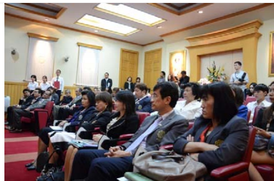
ภาพบรรยากาศภายในพิธีลงนามบันทึกข้อตกลงความร่วมมือฯ

พิธีลงนามบันทึกข้อตกลงความร่วมมือ การติดตั้งระบบสื่อสารข้อมูลแบบไร้สาย (Wireless LAN) ระหว่างมหาวิทยาลัยศรีนครินทรวิโรฒและบริษัท ทูคอบีเอเรชั่น จำกัด (มหาชน)