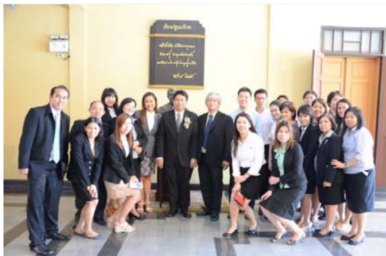
ทีมงานสำนักคอมพิวเตอร์จัดงานในครั้งนี้