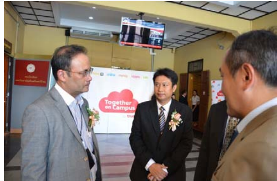
ต้อนรับผู้บริหารบริษัท ทูคคอร์ปอเรชั่น จำกัด (มหาชน)