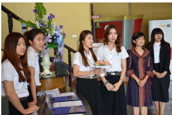
ลงทะเบียนเข้าร่วมงาน