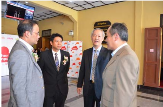
ต้อนรับผู้บริหารบริษัท ทูคคอร์ปอเรชั่น จำกัด (มหาชน)