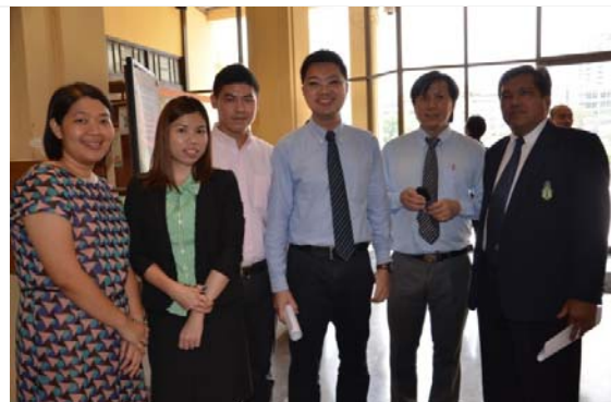
ทีมงานสำนักคอมพิวเตอร์จัดงานในครั้งนี้

พิธีลงนามบันทึกข้อตกลงความร่วมมือ การติดตั้งระบบสื่อสารข้อมูลแบบไร้สาย (Wireless LAN) ระหว่างมหาวิทยาลัยศรีนครินทรวิโรฒและบริษัท ทูช คอร์ปอเรชั่น จำกัด (มหาชน)