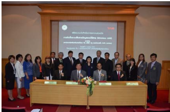
ผู้บริหารของมหาวิทยาลัยและบริษัท ทูช ถ่ายภาพร่วมกัน