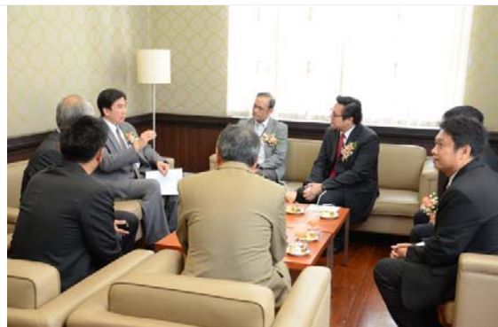
ผู้บริหารมหาวิทยาลัยและบริษัท ทูฯ พบปะพูดคุยก่อนเริ่มพิธีลงนามฯ