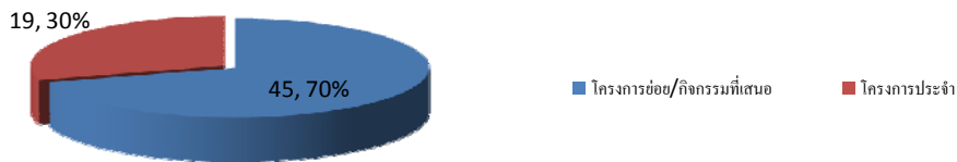
จำนวนโครงการตามแผนปฏิบัติราชการสำนักคอมพิวเตอร์ ปีงบประมาณ 2556