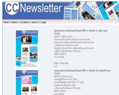
ภาพแสดงหน้าจอ Portal CCNewsletter