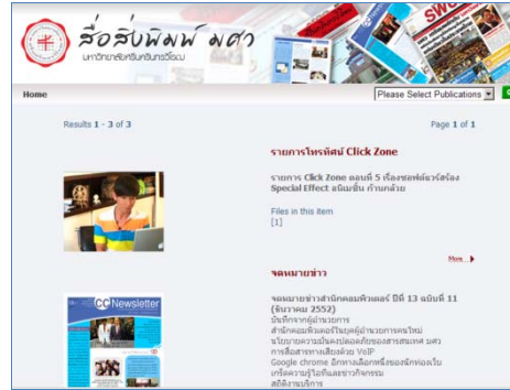
ภาพแสดงหน้าจอ Portal สื่อสิ่งพิมพ์ มศว