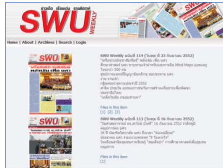
ภาพแสดงหน้าจอ Portal SWU Weekly