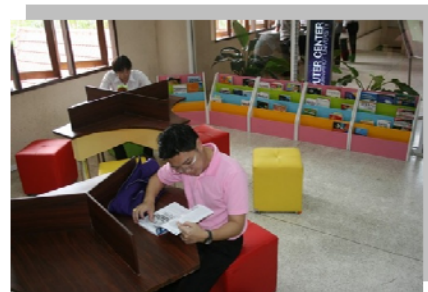
"มุมสบาย สบาย สไตส์ไอที" ให้บริการแก่ผู้ใช้บริการ และบุคลากรสำนักฯ ประสานมิตร : ชั้น 3 อาคาร 16 และองครักษ์ : ชั้น 3 อาคารเรียนรวม