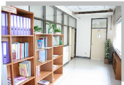
มุมการเรียนรู้สำนักคอมพิวเตอร์ ให้แก่บุคลากรสำนักคอมพิวเตอร์ ชั้น 4 อาคาร 16