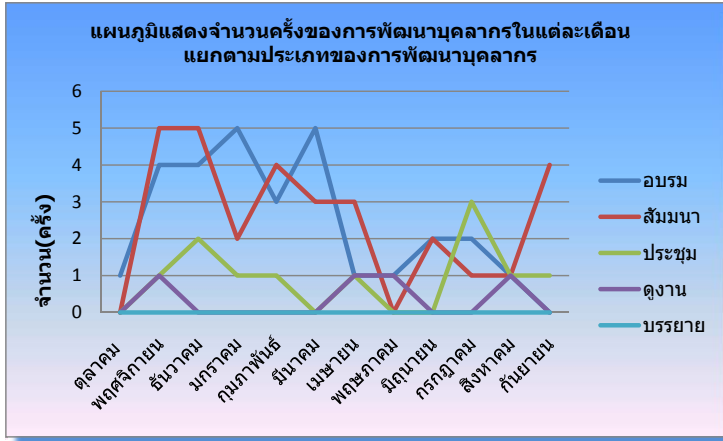
กราฟแสดงสถิติการพัฒนาบุคลากรสำหรับคอมพิวเตอร์ ประจำปีงบประมาณ 2553