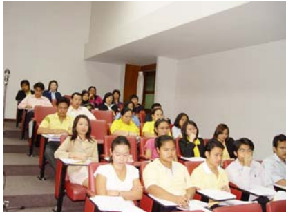
บรรยากาศกิจกรรม