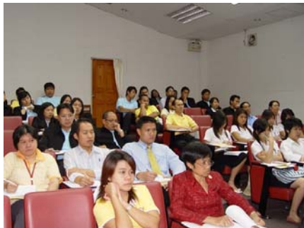
บรรยากาศกิจกรรม