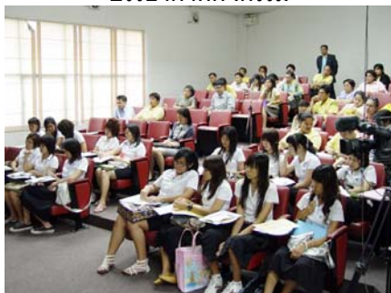
บรรยากาศกิจกรรม