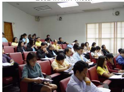
บรรยากาศกิจกรรม