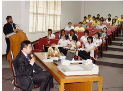
บรรยากาศกิจกรรม