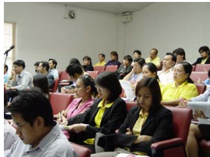
บรรยากาศกิจกรรม