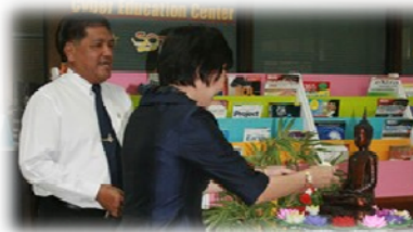
ผู้บริหารร่วมกิจกรรมสงฆ์พระพุทธรูป

สำนักคอมพิวเตอร์ จัดโครงการทำนุบำรุงศิลปวัฒนธรรม สำนักคอมพิวเตอร์ กิจกรรม "งานสืบสานประเพณีวันสงกรานต์" เพื่อให้บัณฑิต คณาจารย์ และบุคลากรที่มารับบริการที่สำนักคอมพิวเตอร์ รวมทั้งผู้บริหาร และบุคลากรของสำนักคอมพิวเตอร์ พร้อมทั้งนิสิตฝึกงานได้ร่วมกิจกรรมเพื่อสร้างความสัมพันธ์และร่วม สืบสานประเพณีอันดีงามต่อไป ระหว่างวันที่ 7-9 เมษายน 2553 และในปีนี้ สำนักคอมพิวเตอร์ได้เข้าร่วมจัดกิจกรรมงานสงกรานต์ไทย น้ำใจ มศว ซึ่งจัดโดยมหาวิทยาลัยศรีนครินทรวิโรฒในวันที่ 8 เมษายน 2553 เพื่อสืบสานและเสริมสร้างวัฒนธรรม อันดีงามที่มีมาแต่โบราณ และเพื่อให้บุคลากรในหน่วยงานต่างๆ ได้มีโอกาสร่วมกิจกรรมเพื่อสร้างความสัมพันธ์อันดีต่อกัน และเป็นส่วนหนึ่งในยุทธศาสตร์การบริหารมหาวิทยาลัย ณ มหาวิทยาลัยศรีนครินทรวิโรฒ องครักษ์