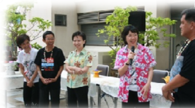
ผู้อำนวยการกล่าวเปิดกิจกรรมรดน้ำขอพร ผู้ใหญ่