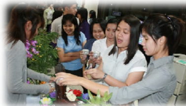
บุคลากรร่วมกิจกรรมสงฆ์พระพุทธรูป