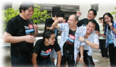
บรรยากาศทั่วไป