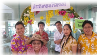
ทีมงานเข้าร่วมกิจกรรมงานสงกรานต์ไทย น้ำใจ มศว