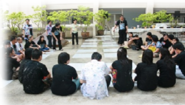
การเล่น "มอญซ่อนผ้า"