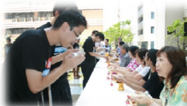
บุคลากรร่วมกิจกรรมรดน้ำขอพรผู้ใหญ่