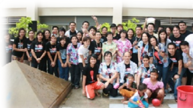
ถ่ายภาพร่วมกัน