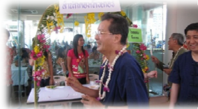
อธิการบดีเยี่ยมชมนักคอมพิวเตอร์