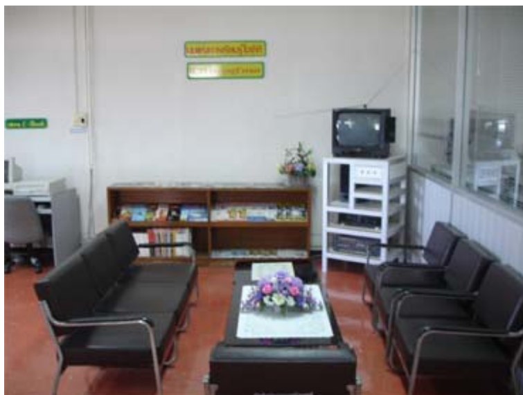
มุมแห่งการเรียนรู้ไอซีทีที่ มศว องครักษ์