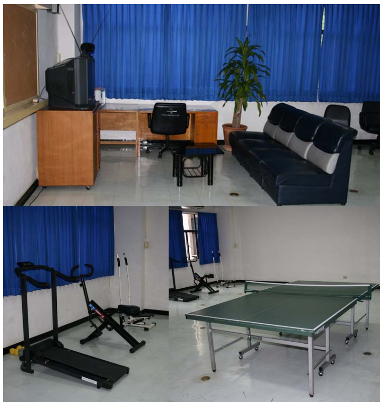
ห้องสวัสดิการ (ห้อง 16-206)