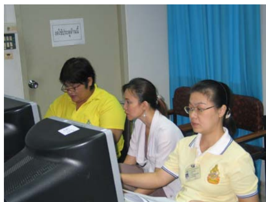
บรรยากาศึกษากิจกรรม