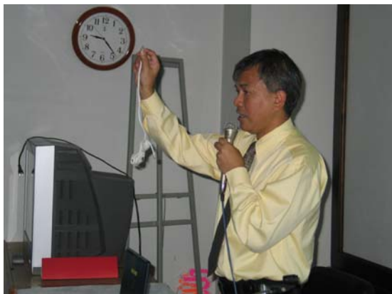
วิทยากร บรรยาย