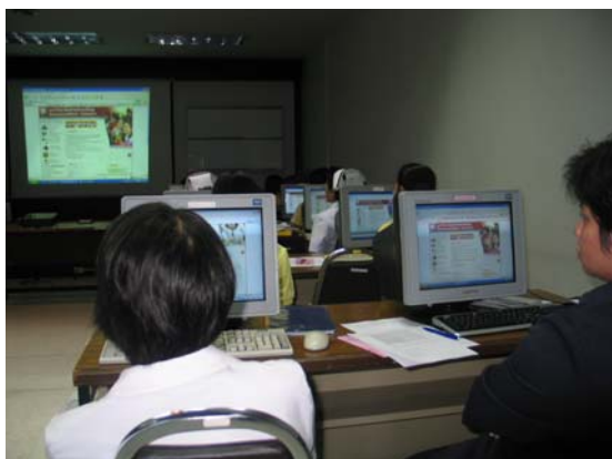
บรรยากาศึกษากิจกรรม