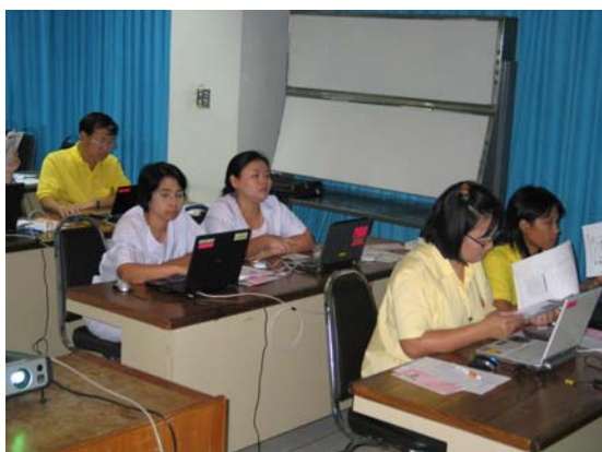
บรรยากาศึกษากิจกรรม