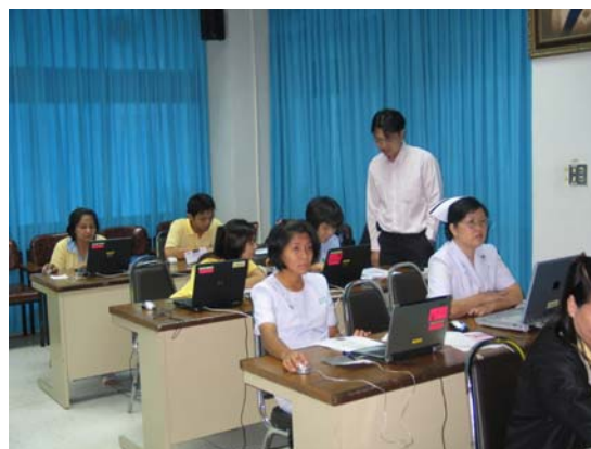
บรรยากาศึกษากิจกรรม