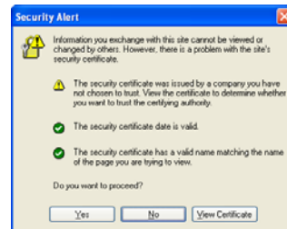
รูปที่ 2 IE6 warning

กรณีที่ไม่สามารถเข้าหน้าหลักของ I-Pass ได้ซึ่งจะพบกับหน้าจอคล้ายกับ error ซึ่งจะมีด้วยกันหลายรูปแบบ ในกรณีที่ เป็น Internet Explorer 6 และ Internet Explorer 7 จะปรากฏดังนี้