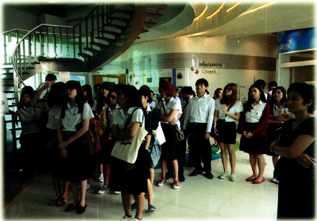
รูปภาพประกอบโครงการศึกษาดูงานในรายวิชาสัมมนาทางเศรษฐศาสตร์ (ศร 483) วันอังคารที่ 20 ตุลาคม 2558