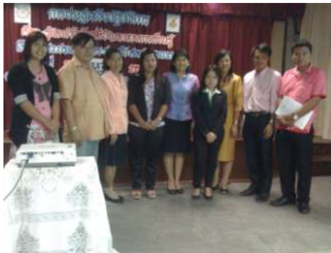
วิทยากร อาจารย์ ผู้บริหาร ศึกษานิเทศก์ และผู้เข้าร่วมอบรม

ระยะที่ 1 เรื่อง รู้และเข้าใจเด็กที่มีปัญหาทางการเรียนรู้ จัดอบรมให้ความรู้แก่ครูและผู้ปกครองของเด็กที่มีความบกพร่องทางการเรียนรู้ในวันอังคารที่ 15 มีนาคม 2554 ณ ห้องประชุมสำนักงานเขตพื้นที่การศึกษา จังหวัดนครนายก โดยมีวัตถุประสงค์เพื่อเผยแพร่ความรู้ความเข้าใจเกี่ยวกับการดูแลและช่วยเหลือเด็กที่มีปัญหาทางการเรียนรู้แก่ผู้ปกครอง และเพื่อให้ผู้ปกครองมีความสามารถ ในการส่งเสริมการอ่านแก่เด็กที่มีปัญหาทางการเรียนรู้