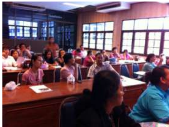
ผู้เข้าร่วมการประชุมเชิงปฏิบัติการรับฟังการบรรยายและสาธิตการจัดทำสื่อประกอบการสอน