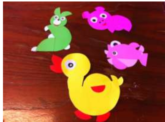
อาจารย์พัชรีวรรณ คุณชื่น วิทยากรสาธิตการทำสื่อประกอบการสอนอ่าน