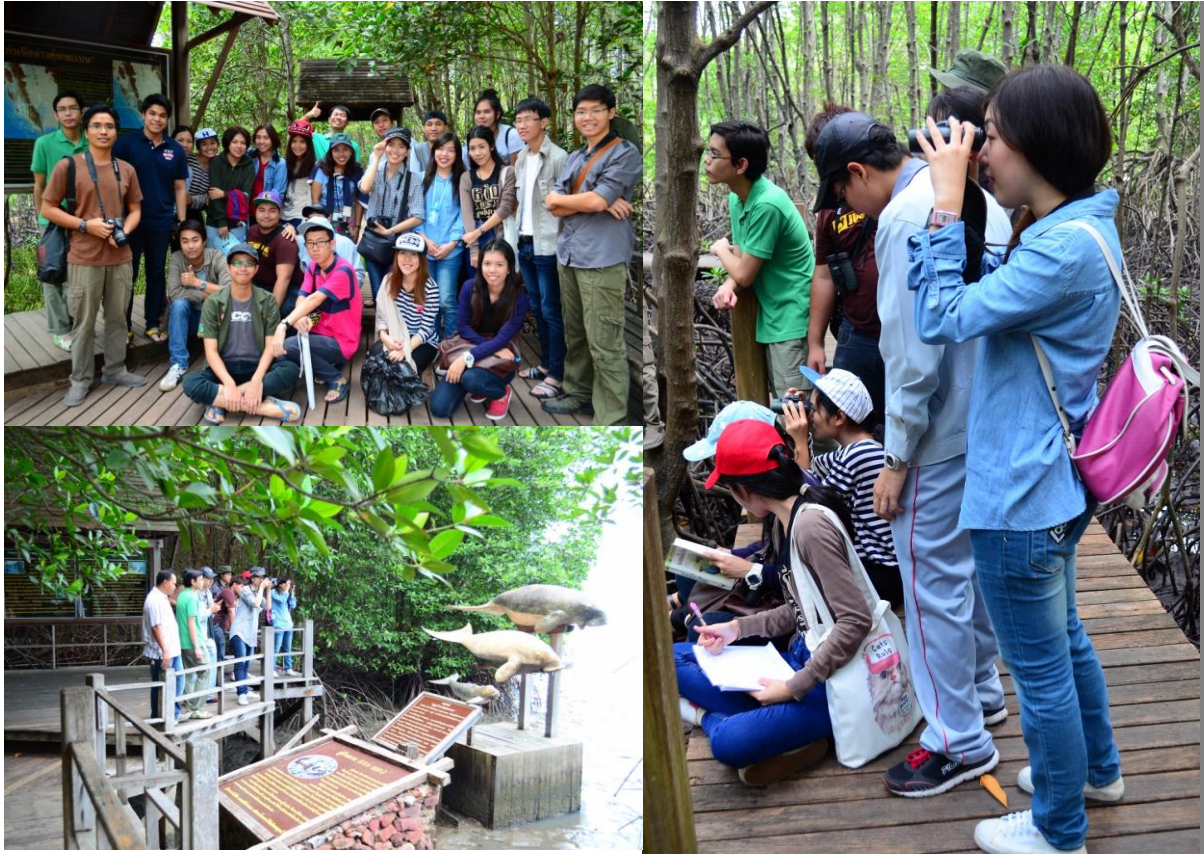
ภาพที่ 1 การทำกิจกรรม ณ ศูนย์ศึกษาการพัฒนาอ่าวคุ้งกระเบนอันเนื่องมาจากพระราชดำริ