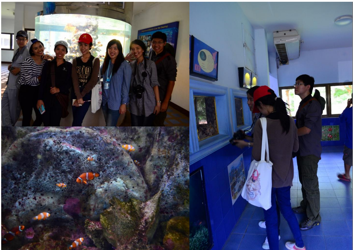
ภาพที่ 2 การทำกิจกรรม ณ สถานแสดงพันธุ์สัตว์น้ำเฉลิมพระเกียรติ 6 รอบ พระชนมพรรษา