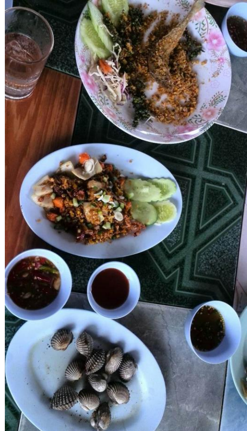
ภาพที่ 6 อาหารกลางวันและเย็นวันที่ 28 มีนาคม 2558