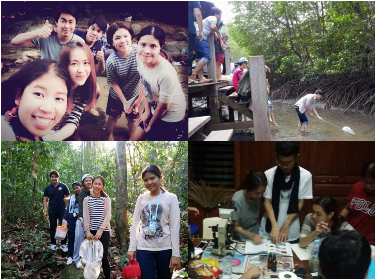
ภาพที่ 4 การศึกษาโปรโตซัวของนิสิตและคณาจารย์ ณ คุ้งกระเบนและอุทยานแห่งชาติน้ำตกพลิ้ว