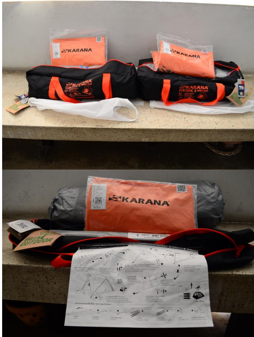
ภาพที่ 9 วัสดุที่ใช้ในการศึกษาภาคสนาม: เต็นท์ 2 หลัง