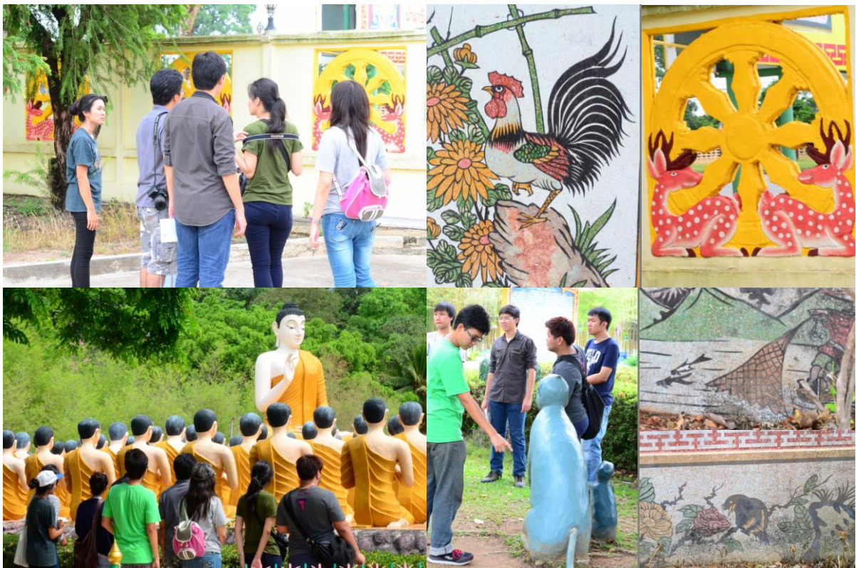
ภาพที่ 5 ศึกษาศิลปวัฒนธรรม ณ วัดมิ่งกรบุปผาราม และพุทธอุทยานวัดชากใหญ่ จังหวัดจันทบุรี