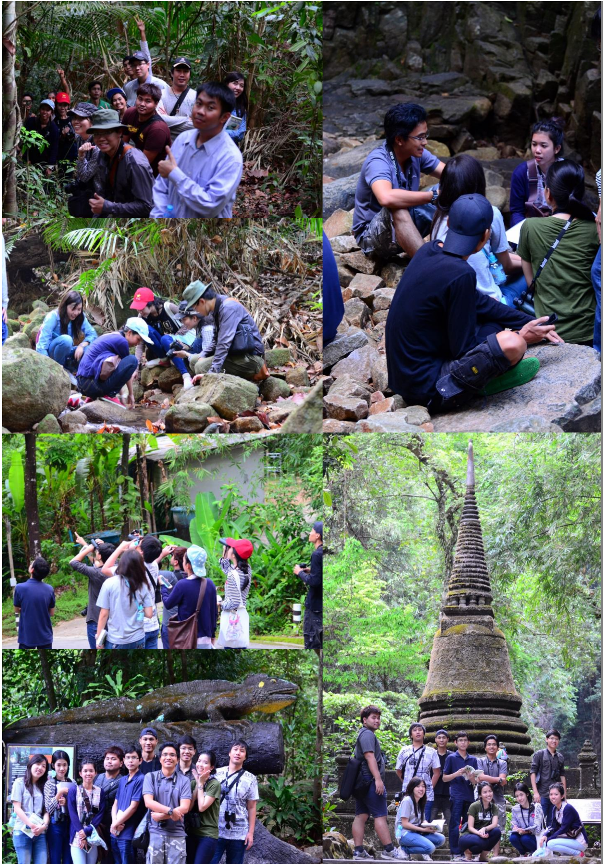
ภาพที่ 3 การทำกิจกรรม ณ อุทยานแห่งชาติน้ำตกพลิ้ว