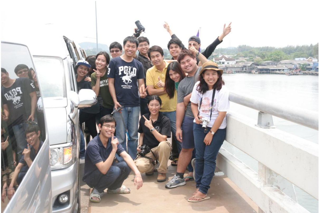
ภาพที่ 10 การเดินทางไปและกลับ กรุงเทพฯ-จันทบุรี ในการศึกษานอกสถานที่ที่กับริดผู้จำนวน 3 คน