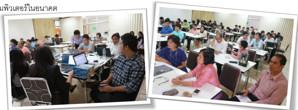
การจัดสรรอัตรากำลังงานมหาวิทยาลัย สายสนับสนุนวิชาการ ประจำปีงบประมาณ พ.ศ. 2557