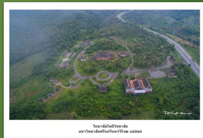
วิทยาลัยโพธิวิชชาลัย มหาวิทยาลัยศรีนครินทรวิโรฒ แม่สอด